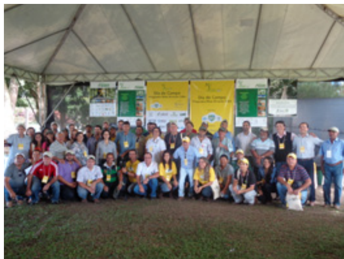
Grupo reunido no Dia de Campo realizado no Extremo Sul da Bahia