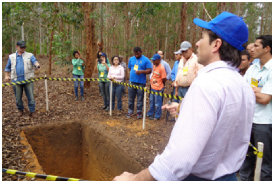
A importância da correção do solo foi mostrada durante a visita técnica

Texto: Yara Vasku (colaboração de Leonardo Coutinho)