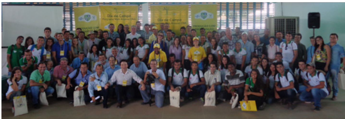
Grupo participante das palestras e da visita técnica durante o Dia de Campo em Barreiras (BA), realizado em 10 de julho de 2015