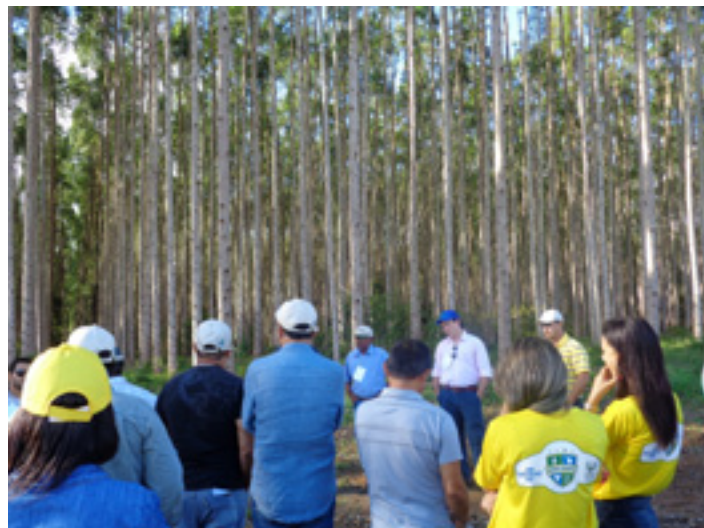
Produtores foram aprender mais sobre o manejo do eucalipto