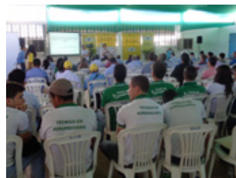
Muitos estudantes da área de agropecuária foram conferir o Dia de Campo em Barreiras