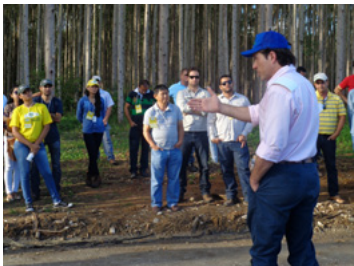
Grupo visitou a plantação de eucalipto na Fazenda Gameleira