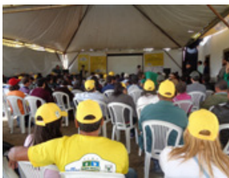
Palestras sobre manejo e gestão de propriedade