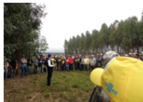
Visita técnica aconteceu entre os eucaliptos da Fazenda Santana