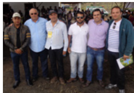
Produtores da região compareceram ao evento