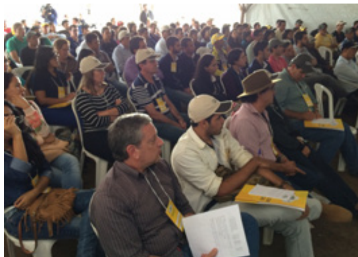
Público compareceu em massa no evento no Sudoeste da Bahia