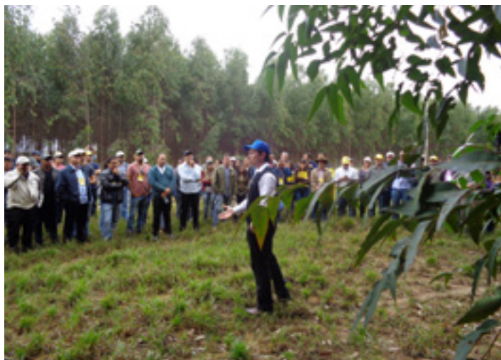
A Fazenda Santana foi a parceira no evento realizado em Vitória da Conquista