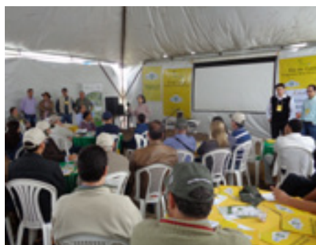
Palestras no Dia de Campo Vitória da Conquista