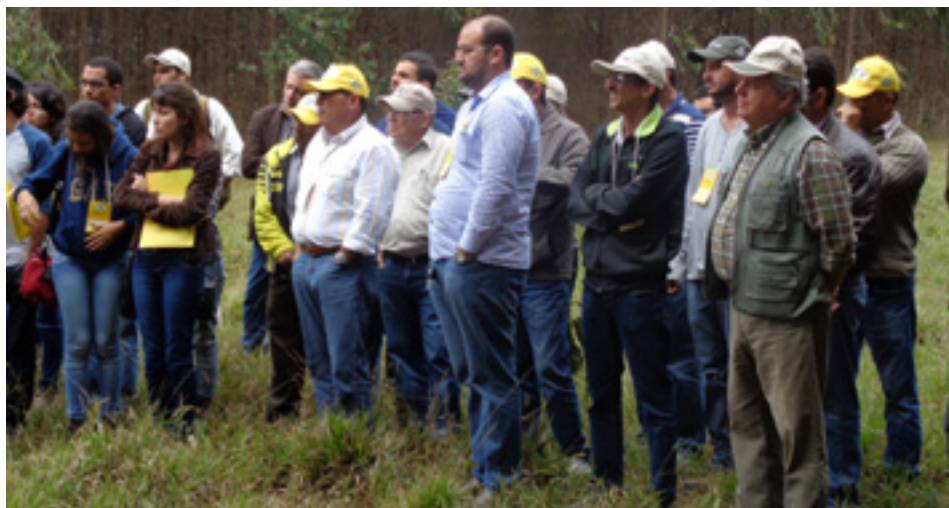
Produtores e interessados em plantio florestal acompanharam o evento

nenhum estudo, sem nenhuma comprovação, atrapalham a produção desta madeira. E aqui vemos que temos energia renovável, com produção rápida. Que este projeto se estenda, inclusive para comunidades, pois, Vitória da Conquista tem uma área rural muito grande. O importante é diversificar com tecnologia”, ressalta o vereador.