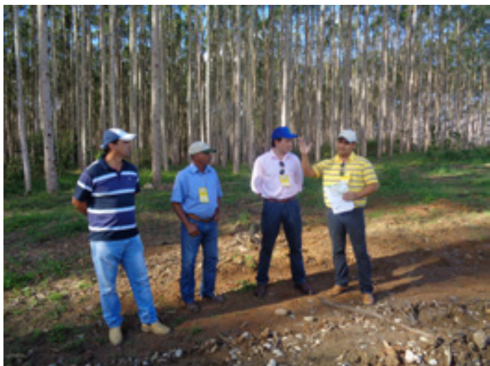
Os representantes da fazenda acompanharam a visita técnica