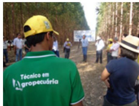
Grupo da Fazenda das Águas

rou que o Dia de Campo é importante para tentar inserir tecnologia adequada para a região que possui períodos longos de chuva e de estiagem. “É preciso encontrar uma matriz genética adaptada para a situação climática. E depende de investimento em tecnologia, e somente com eventos como esse, com o intercâmbio entre produtores e pesquisadores, poderá avançar na produtividade para atrair cada vez mais produtores”.