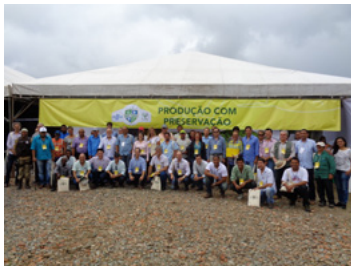
Grupo presente no Dia de Campo acompanhou as palestras e a visita técnica