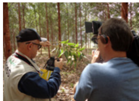
Equipe Mais Floresta