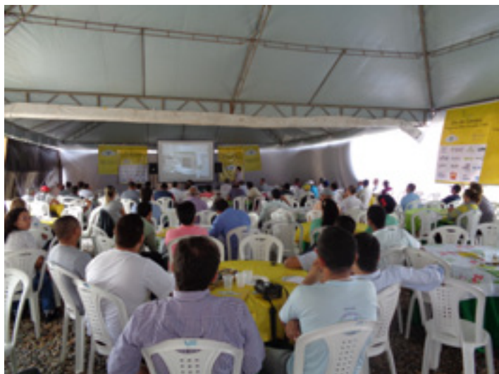
O primeiro Dia de Campo na Bahia foi na Fazenda Salgado, em Inhambupe