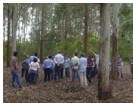
Grupo presente no Dia de Campo acompanhou as palestras e a visita técnica